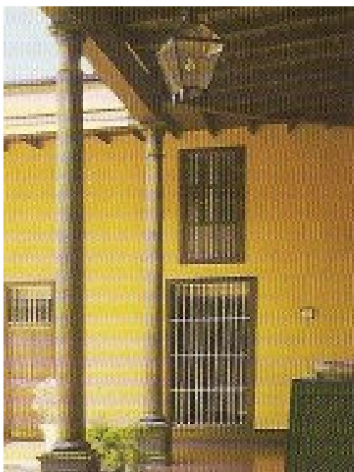
Tercer patio. Sucursal Trujillo

La función principal de las sucursales es representar al Banco en el ámbito de su influencia, elaborando información y estudios sobre la economía regional; llevando a cabo eventos en su jurisdicción como cursos, seminarios, talleres, conferencias y conversatorios, entre otros, sobre aspectos económicos y financieros; y asegurando un adecuado nivel, calidad y composición de circulante (billetes y monedas) en su región.