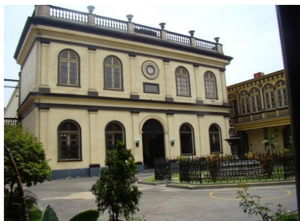
Edificio Principal de la Casa Nacional de la Moneda

En ese mismo sentido, se ha restaurado el antiguo Tribunal Mayor de Cuentas, hermosa edificación que data de la época colonial y que forma parte del conjunto arquitectónico de la Casa Nacional de Moneda.