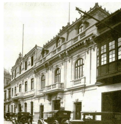
Fachada del Banco de Reserva del Perú, 1922

El primer local que ocupó el Banco de Reserva fue el de las instalaciones de la Junta de Vigilancia de Cheques Circulares en la cuadra 2 del Jirón Miroquesada.