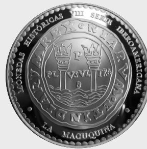
VIII Serie Monedas Históricas Iberoamericanas 2010