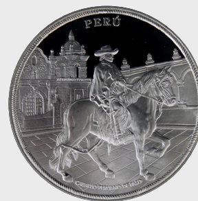
IV Serie El Hombre y su Caballo 2000