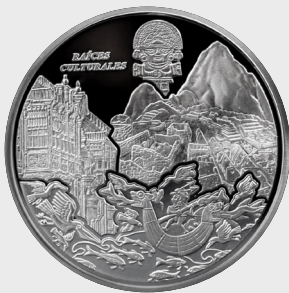
X Serie Raíces Culturales 2015