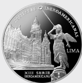
XIII Serie Capitales Iberoamericanas 2024