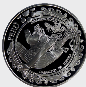
V Serie La Náutica 2002