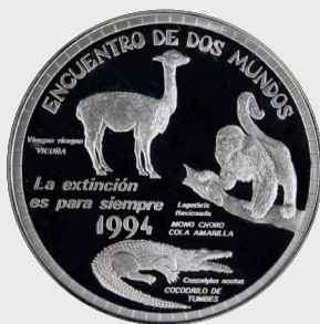
II Serie Animales Autóctonos en Peligro de Extinción 1994