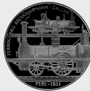
XII Serie Ferrocarriles Históricos 2019