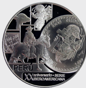
IX Serie XX Aniversario 2012