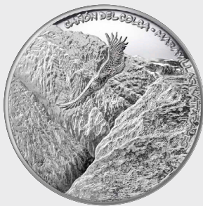
XI Serie Maravillas Naturales 2017