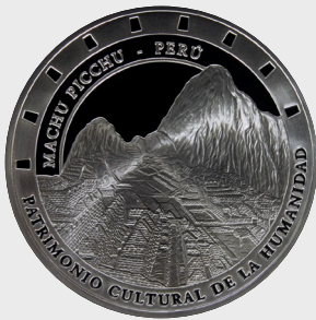
VI Serie Arquitectura y Monumentos 2005