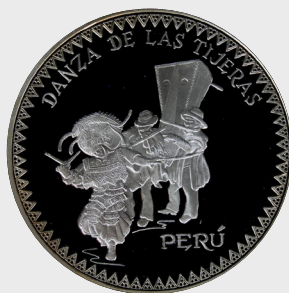
III Serie Danzas y Trajes Típicos Iberoamericanos 1997