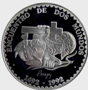
I Serie Encuentro de Dos Mundos 1992