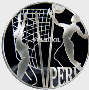
VII Serie Países Iberoamericanos y los Deportes Olímpicos 2007