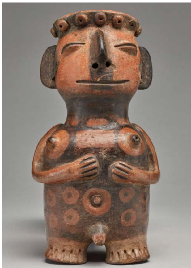
Figura 5. Vasija con persona de cuerpo decorado (ACE0762).

se menciona no sugiere que las colecciones no deban estudiarse. Por el contrario, desde el inicio de la arqueología, las colecciones en museos han sido fundamentales para clasificar el tiempo y los grupos sociales, pues contienen objetos completos que solo ocasionalmente se encuentran en trabajos arqueológicos. Pero esta investigación debe darse con un total entendimiento de la historia reciente de estos objetos, es decir, de dónde se obtuvieron, cómo fueron obtenidos y cómo se formó la colección, y apoyándose de las investigaciones arqueológicas más recientes para poder interpretar estas obras en un contexto más completo.