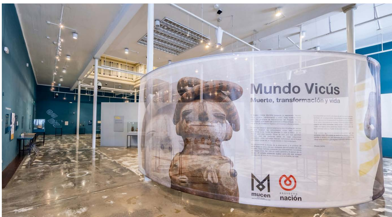
Figura 3. Exposición temporal “Mundo Vicús: Muerte, transformación y vida”.

te, cuando se exponen y publican, se da preferencia a los más llamativos, a veces con contenidos más exóticos, otras veces con escenas más familiares, y casi siempre de manufactura excelsa. De esta forma, una exhibición de objetos arqueológicos puede crear una visión de estas sociedades que puede contrastar con la información que los arqueólogos de campo registran en sus investigaciones 5 . Esto que