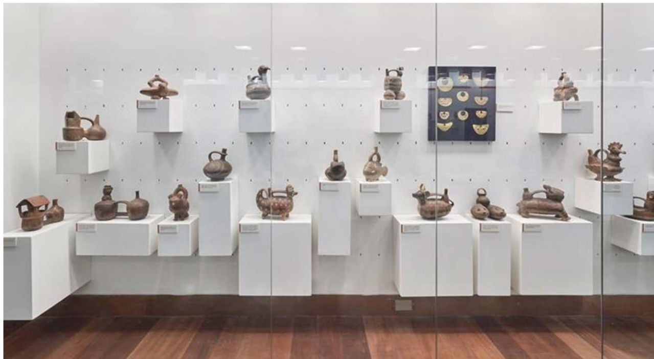
Figura 2. Vista de las vitrinas con objetos Vicús en la sala de arte precolombino del MUCEN.

objetos arqueológicos —todos pertenecientes a la colección Domingo Seminario—, que se sumaron a la colección de arte y de piezas arqueológicas que ya poseía (BCRP, 1972). Estas se incorporaron al actual Museo Central cuando abrió sus puertas al público en 1982 (Figura 2).