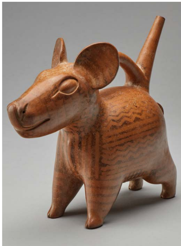
Figura 1. Vasija cerámica que participó en la exhibición “Mastercrafters of Ancient Peru”. (ACE0892)

Es importante comprender que si bien la práctica arqueológica ya tenía décadas en el país y el pasado precolombino ya se afianzaba como una parte integral de la identidad nacional (Asensio, 2018; Tantaleán, 2016), la profundidad del conocimiento de ese pasado a mitad del siglo veinte palidece frente a lo que comprendemos hoy. La arqueología de ese entonces concentraba mucho de sus esfuerzos en la clasificación de unidades temporales (periodos o etapas) y de unidades culturales o estilísticas. El descubrimiento de estos objetos en Morropón llamó la atención no solo por su cantidad, sino también porque el estilo artístico de estos no correspondía a lo que se conocía en aquel momento. Si bien muchos objetos eran estilísticamente parecidos al mochica, muchos otros eran muy distintos en forma, decoración y manufactura. Es decir, el presente texto es la historia de la identificación de comunidades antiguas cuyo arte se diferenció lo suficiente del de sus vecinos para que los arqueólogos del siglo veinte le coloquen un nombre para su distinción. El artículo de Ramiro Matos Mendieta en la Revista del Museo Nacional 1965-66 (1969) y la breve publicación de Rafael Larco Hoyle, La cerámica de Vicús (1965), son dos importantes estudios que marcan dicho momento.