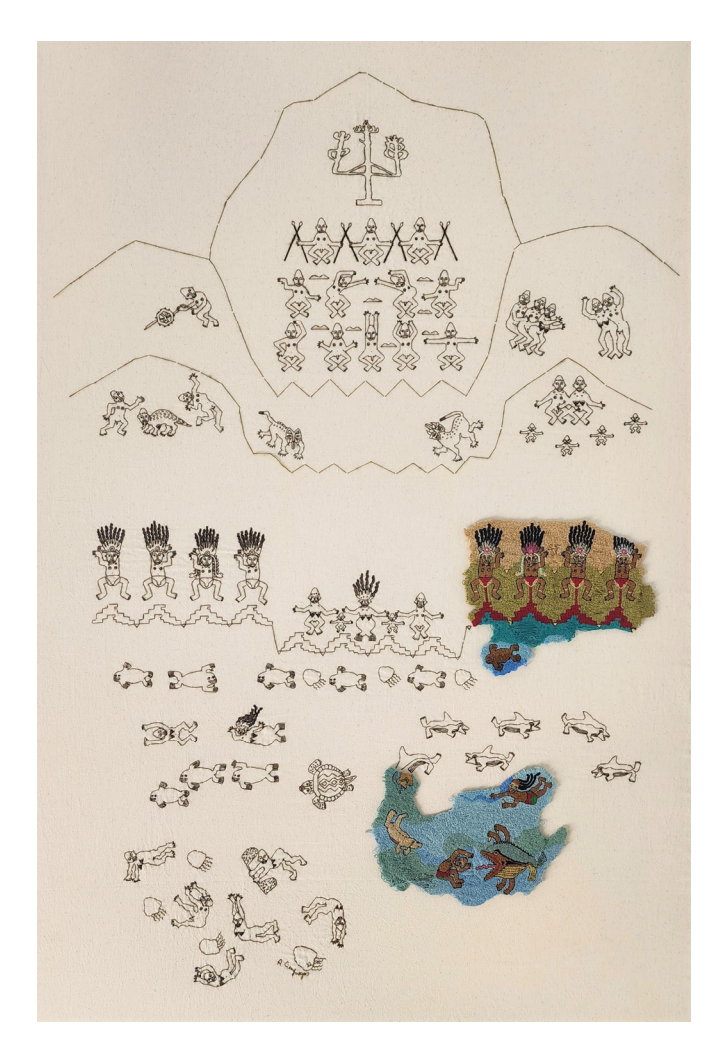
Angie Cienfuegos, Representaciones del mundo según la Cultura Afrolítica peruana. Piezas para un museo posible (2022).