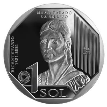
María Parado de Bellido

En las tres monedas se aprecia, al lado derecho, un diseño geométrico de líneas verticales y la marca de la Casa Nacional de Moneda. Al lado izquierdo la frase BICENTENARIO 1821-2021, la denominación en número y el nombre de la unidad monetaria. Al lado de la denominación se aprecia el isotipo del Bicentenario, como símbolo de la serie.