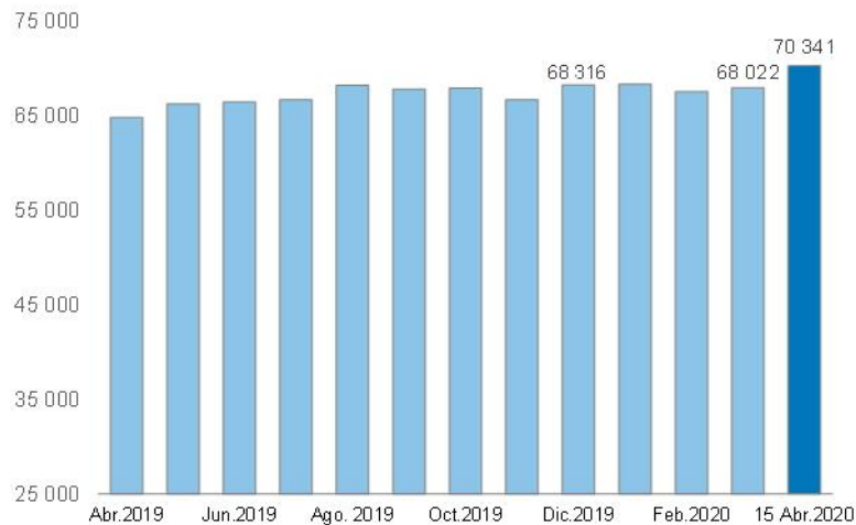
Reservas Internacionales Netas (Millones de US$)

Dentro de los componentes de las reservas internacionales, la Posición de Cambio al 15 de abril ascendió a US$ 43 808 millones, monto mayor en US$ 234 millones a la del cierre de marzo y superior en US$ 1 189 millones a la registrada a fines de diciembre de 2019.