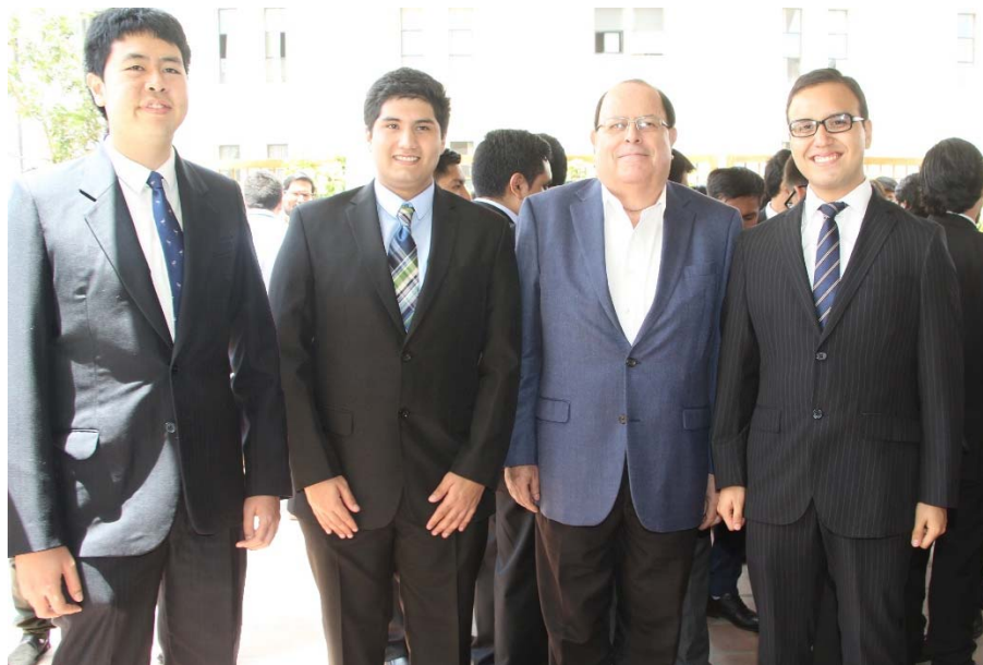
El Presidente del Banco, Julio Velarde, y los tres primeros lugares del Curso de Finanzas Avanzadas

El Curso de Economía data de 1961 y fue creado en el marco del interés del Banco Central de contar con cuadros técnicos en el campo de la economía, pues por entonces, como ahora, era imprescindible contar con profesionales de sólida formación académica para la formulación y gestión de la política monetaria.