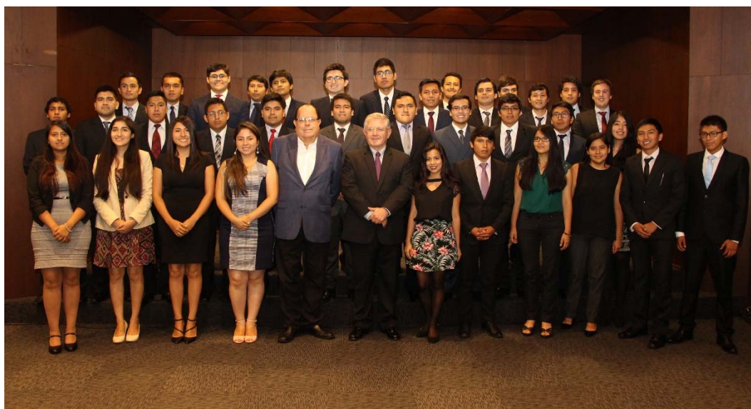
El Presidente del BCRP, Julio Velarde y el Gerente General Renzo Rossini, con los estudiantes del curso de Economía

A lo largo de estas más de cinco décadas, el curso ha contribuido a la formación de economistas que desempeñan o han desempeñado cargos claves en las instituciones públicas y privadas más importantes del país.