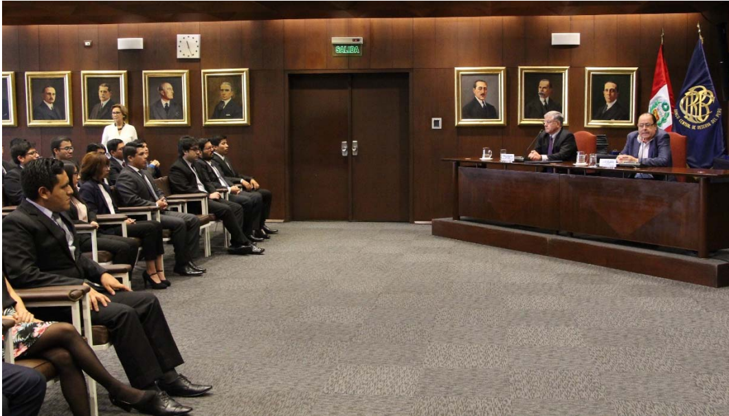
El presidente del BCRP, Julio Velarde, clausuró los Cursos de Extensión Universitaria 2019

El presidente del Banco Central de Reserva del Perú, Julio Velarde, clausuró el Curso de Extensión Universitaria que este año capacitó a los 66 de los mejores estudiantes universitarios del país de las carreras de economía, y otras afines, en sus dos prestigiosas especialidades, de Economía y de Finanzas Avanzadas, las que concluyeron este 28 de marzo.