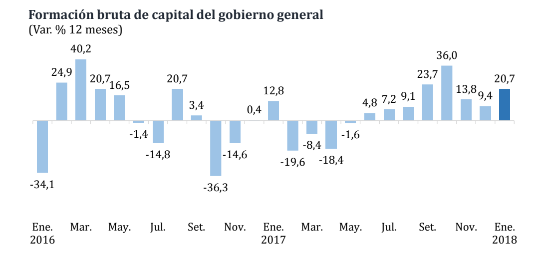
Lima, 16 de febrero de 2018

Por su parte, la inversión del gobierno general creció por octavo mes consecutivo en enero de 2018 al registrar un aumento de 20,7 por ciento. Destacó el aumento de la inversión del gobierno nacional en 23,1 por ciento y de los gobiernos locales en 34,9 por ciento.