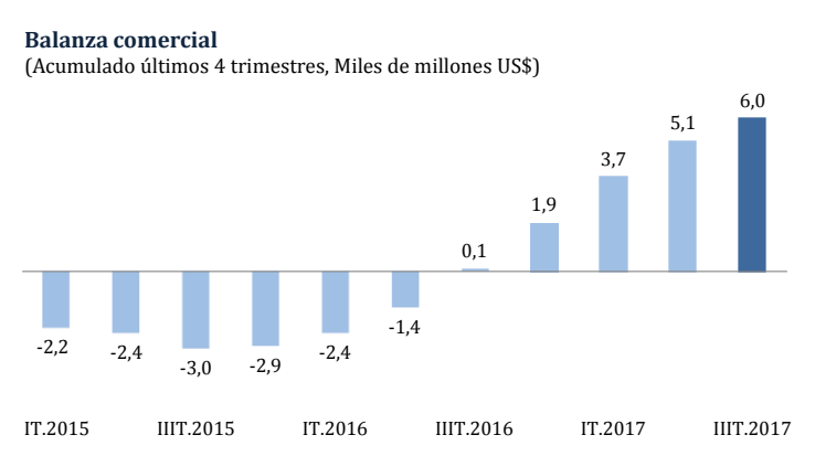
Lima, 25 de noviembre de 2017

Con ello, la balanza comercial acumula cinco trimestres consecutivos de superávit, equivalente a US$ 6 mil millones en los últimos cuatro trimestres, el monto más alto desde el cuarto trimestre de 2012 (US$ 6,3 mil millones).