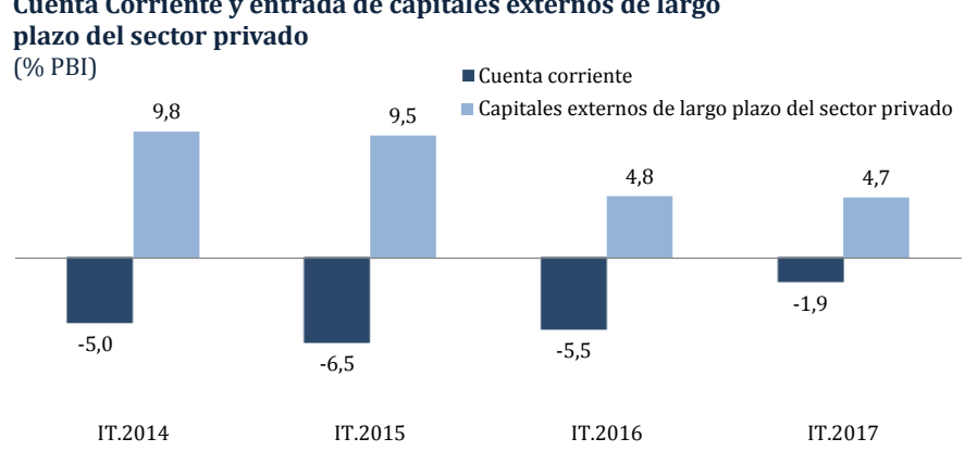
Cuenta Corriente y entrada de capitales externos de largo

El déficit en cuenta corriente está compensado por el ingreso de capitales privados de largo plazo. En el primer trimestre de 2017 se recibió inversión directa extranjera y desembolsos de largo plazo del sector privado equivalente a 4,7 por ciento del producto.