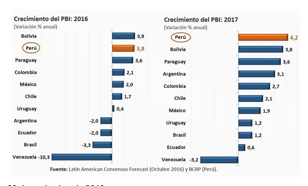
Lima, 20 de noviembre de 2016