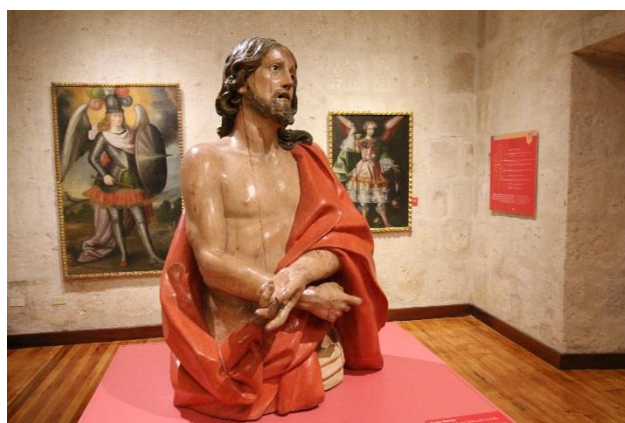
Exhibición de 41 piezas de arqueología y 36 obras artísticas

También incluye una importante colección numismática que incorpora a la Serie Riqueza y Orgullo del Perú que el BCR ha acuñado y lanzado a lo largo de los últimos 5 años. En esta serie, destaca como Patrimonio de la Región Arequipa la moneda alusiva al Monasterio de Santa Catalina, que estuvo entre las mejores 10 monedas del mundo nominada al premio Moneda del Año 2013 en la categoría mejor diseño, organizado por la afamada revista Krause.