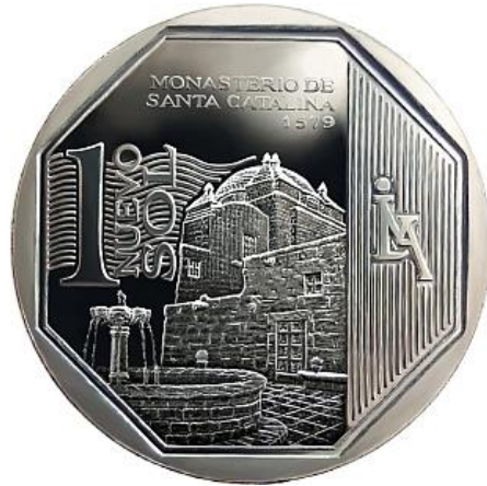
Moneda de S/ 1 alusiva al Monasterio de Santa Catalina