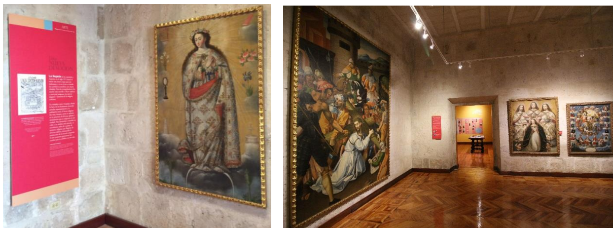
El arte Cusqueño que forma parte del acervo de este Museo

Esta nueva distribución incluye temas de historia de la Moneda, el Banco de Arequipa, la Serie Riqueza y Orgullo del Perú, la Arquitectura de la Casa Goyeneche y de la Casa Bustamante; la Cosmovisión en el antiguo Perú, la representación y simbolismo de nuestros animales a través del arte ancestral (colección de Arqueología), y la denominada Devoción de Altura expresada en la representación de Cristo, la Virgen María, Santos, Santas y Arcángeles en el Arte Colonial de la escuela Cusqueña. Complementa la exposición un espacio interactivo con diversas actividades de exploración y aprendizaje.