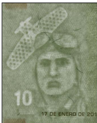
Marca de Agua

Estos billetes poseen los elementos de seguridad conocidos por todos como la marca de agua, la tinta que cambia de color (de fucsia a verde) y el número oculto en la ropa del personaje.