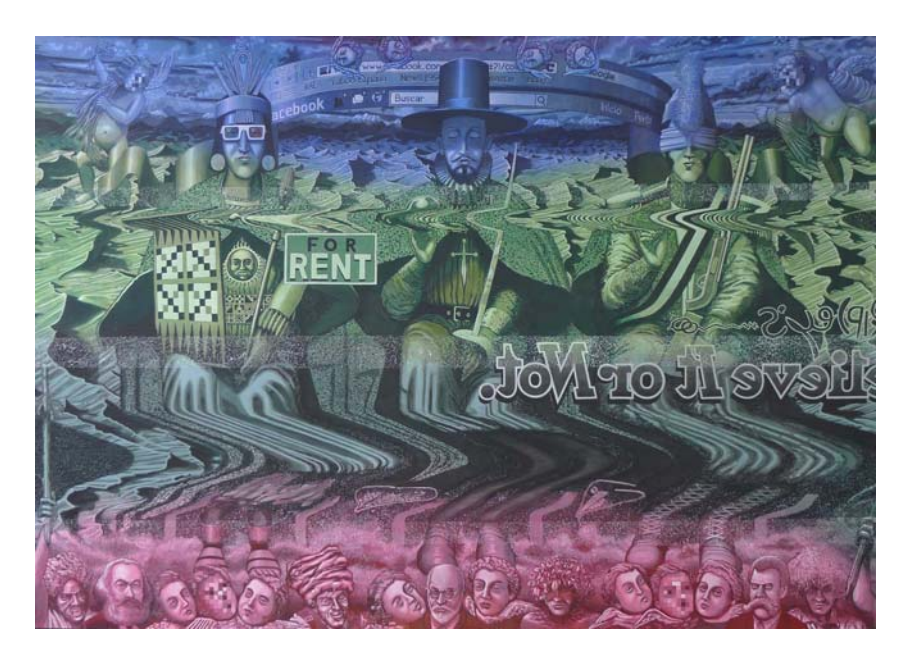
"No hay peor ciego" de Ángel Valdez Rosales