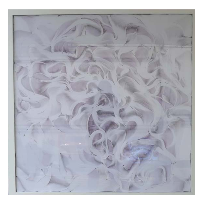
"Sin título" de Kenji Nakama Miyashiro