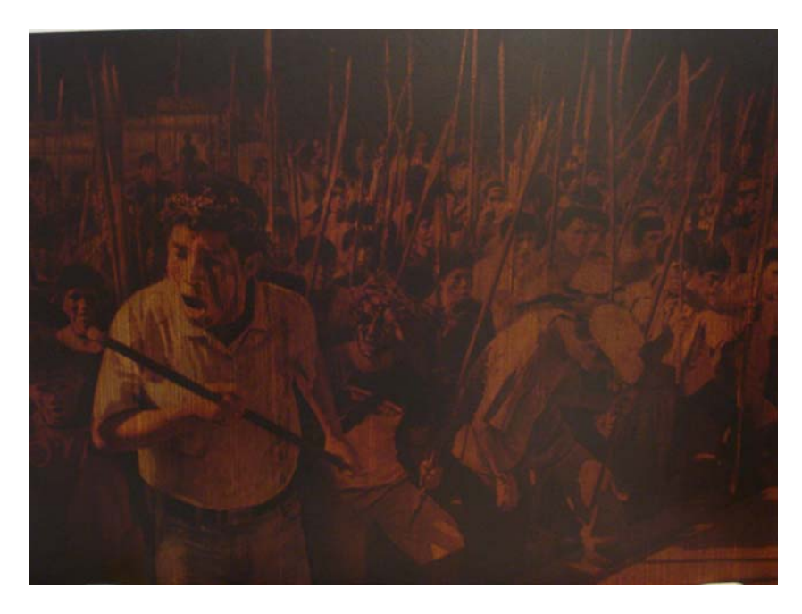
"Los días oscuros nos han encontrado" de Milko Torres Torres