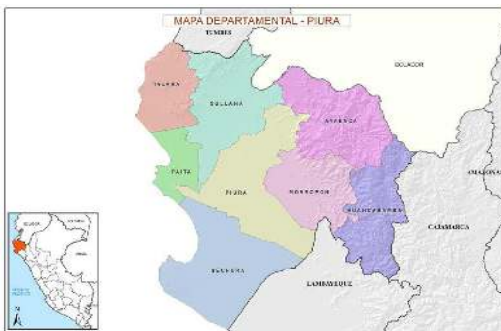
MAPA N° 1 MAPA POLÍTICO DE PIURA

El departamento de Piura está ubicado al noroeste del país. Tiene una superficie de 35 892 km 2 , que representa el 2,8 por ciento del territorio nacional. Limita por el norte con Tumbes y la República del Ecuador; por el este, con Cajamarca y el Ecuador; por el sur, con Lambayeque; por el oeste, con el Océano Pacífico. Políticamente está dividido en 8 provincias y 65 distritos, siendo su capital la ciudad de Piura.