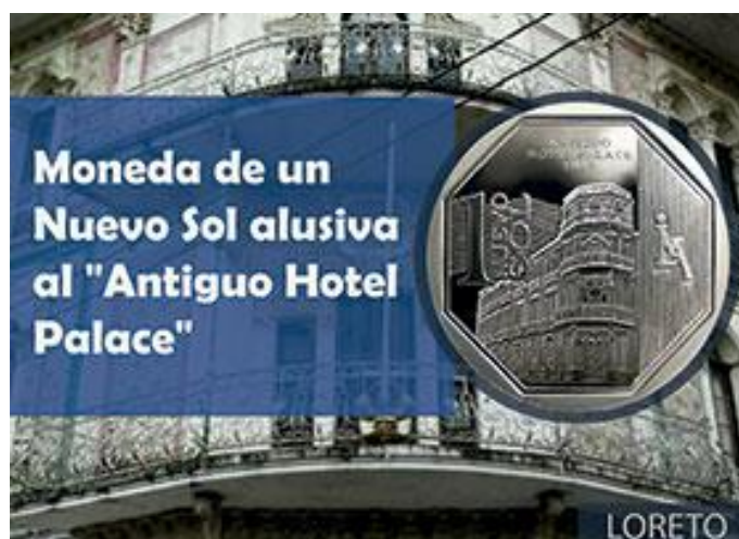
MONEDA ALUSIVA AL “ANTIGUO HOTEL PALACE”

El inmueble fue declarado Patrimonio Cultural de la Nación por Resolución Ministerial N° 793-86-ED del 30 de diciembre de 1986. Actualmente es sede de la Comandancia General de la Región Militar del Oriente.