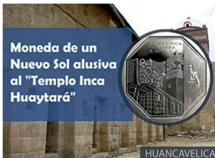
MONEDA ALUSIVA AL “TEMPLO INCA HUAYTARÁ”

El recinto sagrado es de planta rectangular, con muros de sillar labrado, de estilo imperial cusqueño, con puertas y hornacinas trapezoidales de doble y triple jamba. Es una de las construcciones más elegantes del período Inca en el flanco occidental de los Andes. Durante la colonia, en el siglo XVI, fue transformado en iglesia en honor a San Juan Bautista donde se celebra misa hasta el día de hoy, utilizando las hornacinas originales del templo Inca.