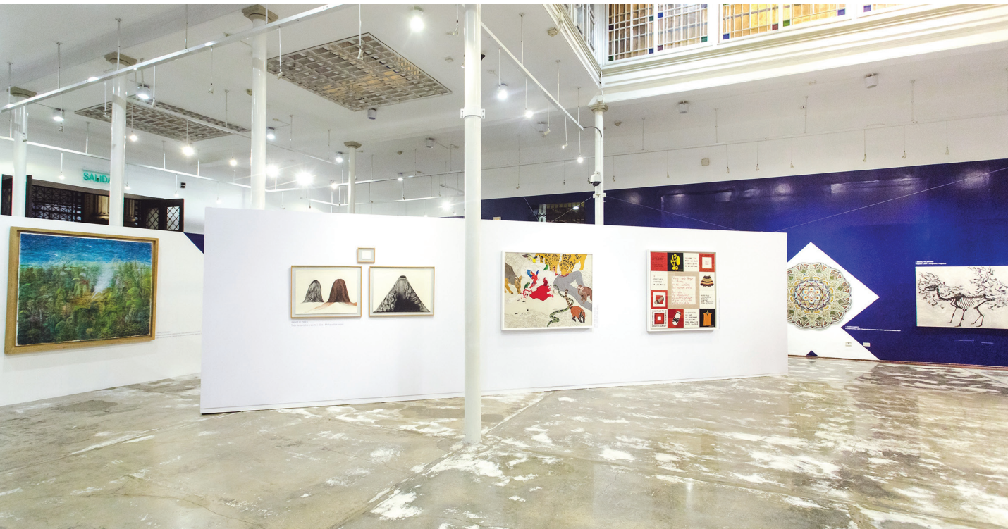
VISTA DE LA EXPOSICIÓN "DIÁLOGOS DESDE LO CONTEMPORÁNEO". EL DISEÑO MUSEOGRÁFICO ESTUVO A CARGO DE LALA REBAZA.

público. Es decir, que si bien este arte utiliza un lenguaje cuyos códigos suelen presentarse bajo formas complejas, nuestro objetivo es emplear estrategias didácticas que permitan que dichas formas, técnicas y significados sean comprendidos por los diversos públicos que ingresan a nuestras salas. Por ello, el trabajo de curaduría incluyó una interpretación detallada de cada una de las veinte obras en exhibición, así como un análisis de cómo estas respondían a una temática especial.