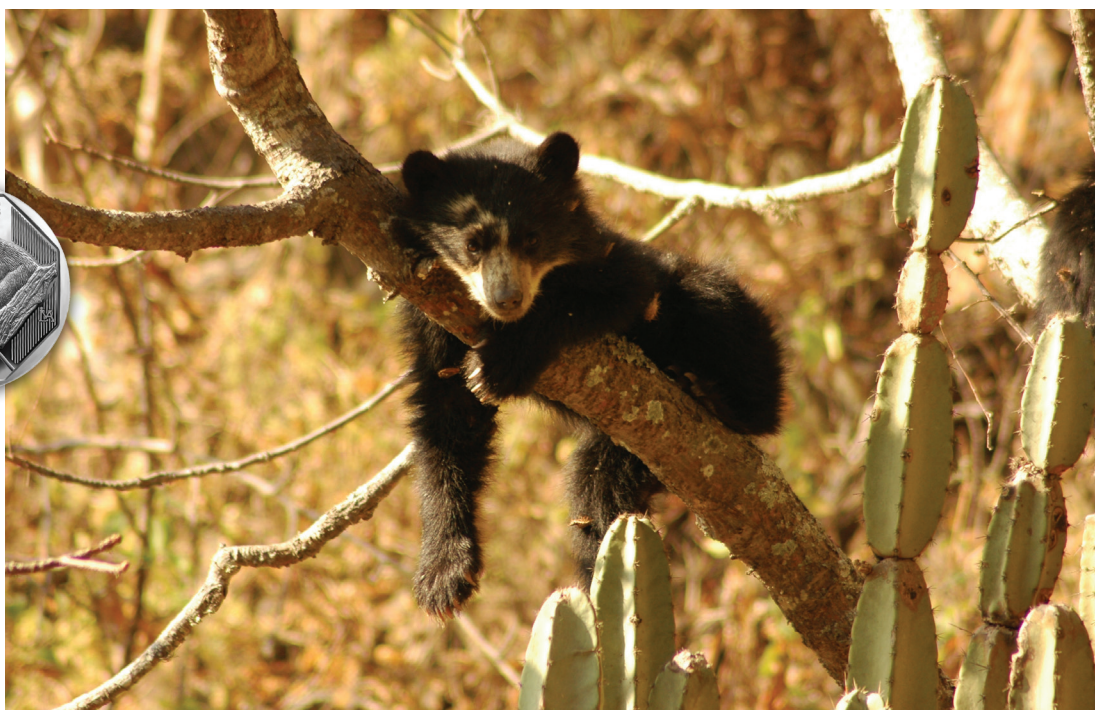
CRÍA DE OSO DESCANSANDO EN EL BOSQUE SECO DEL NORTE PERUANO.

lo posicionan como uno de los omnívoros más grandes del continente.