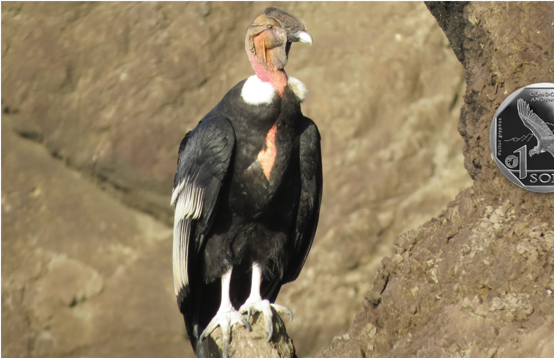
MACHO ADULTO DE CÓNDOR ANDINO EN LA COSTA PERUANA.

vías de extinción; asimismo, está incluido en la categoría más alta de riesgo para la Convención CITES.