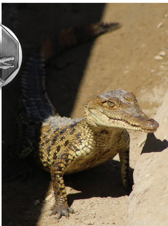
INDIVIDUO JUVENIL DE COCODRILO DE TUMBES.