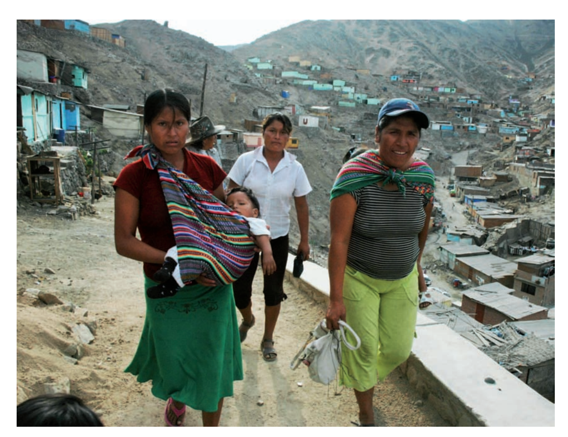
DÉFICIT HABITACIONAL. Demanda potencial apreciable.

Actualmente hay un debate importante sobre las ventajas y desventajas de este último sistema de financiamiento hipotecario, bajo el cual aparecieron las deficiencias que se sindican como principales responsables de la crisis financiera actual: subvaluación del riesgo, excesivo apalancamiento y la creación de instrumentos