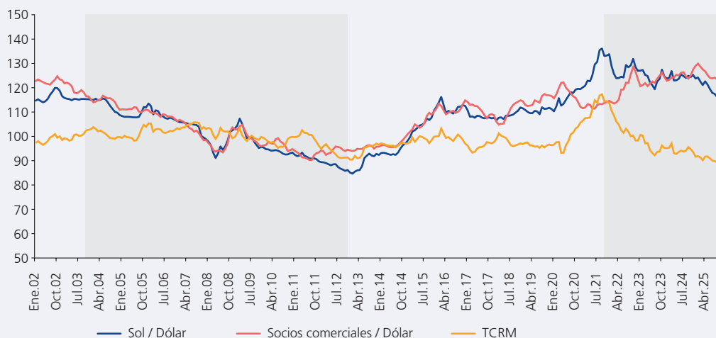
TIPO DE CAMBIO MULTILATERAL (Índice 2009=100)

Nota: El índice Socios Comerciales/dólar es un índice ponderado de los tipos de cambio nominales de las monedas de los socios comerciales frente al dólar. Para esta construcción, se excluye Estados Unidos y Ecuador.