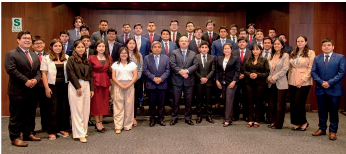
Cursos de Verano 2025