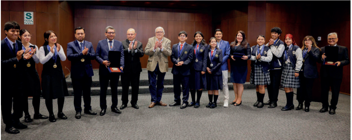
Concurso Escolar BCRP 2025