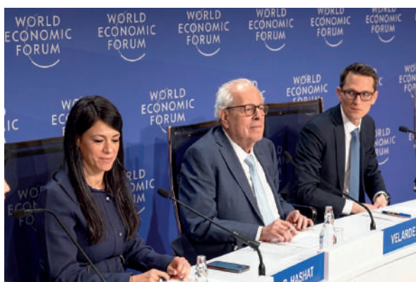
Reunión Anual del World Economic Forum