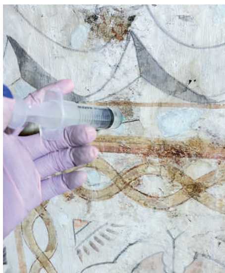
Procesos de consolidación interna del muro

Se llevó a cabo el Proyecto de Conservación de la Pintura Mural del Museo Numismático. La intervención se concentró en el primer piso y comprendió acciones de diagnóstico técnico, limpieza controlada, consolidación de estratos, restitución puntual de morteros compatibles y reintegración de color. Estas acciones permitieron estabilizar el sistema mural y garantizar la adecuada preservación del conjunto patrimonial.