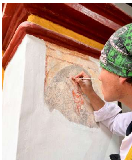
Reintegración de color de murales

Además, se ejecutaron acciones de conservación en los bienes custodiados en las sucursales de Arequipa, Trujillo, Piura, Huancayo y Cusco; se realizó el registro de 79 bienes culturales en el Registro Nacional de Bienes Muebles del Ministerio de Cultura; y se implementó un sistema de código de barras en 6 mil bienes. Asimismo, durante el año se atendieron dos solicitudes de préstamo de bienes culturales para exposiciones nacionales y se brindó atención a 21 investigadores externos interesados en el estudio de las colecciones del MUCEN.