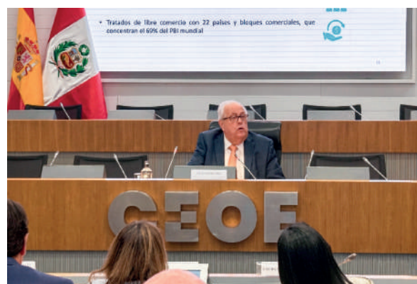
InPERU Roadshow Europa 2025