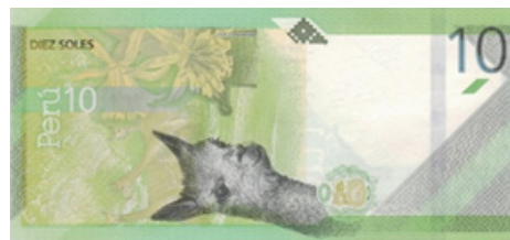
Vicuña-Flor de amancaes