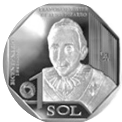
Francisco Xavier de Luna Pizarro