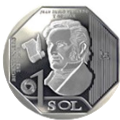
Juan Pablo Viscardo y Guzmán

Desde octubre de 2020, en el marco de la conmemoración del bicentenario de la independencia del Perú, el BCRP ha emitido la serie numismática “Constructores de la República. Bicentenario 1821-2021”, conformada por 9 monedas de alpaca de S/1,00 de curso legal que tienen por finalidad difundir, a través de un medio de pago de uso masivo, la imagen e historia de personajes que tuvieron un rol clave en el proceso por la independencia del Perú. En el año 2023 se emitieron las tres últimas monedas de la serie, alusivas a Francisco Xavier de Luna Pizarro, José de la Mar y Cortázar y José Manuel Valdés.