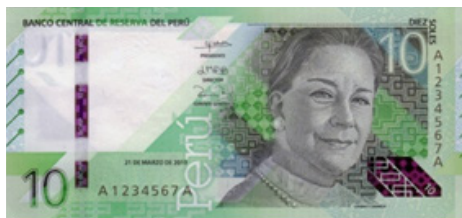
María Isabel Granda y Larco (Chabuca Granda)

El Banco Central de Reserva del Perú puso en circulación desde el 15 de diciembre de 2023, el nuevo billete de S/ 200, cuyo diseño tiene en el anverso la imagen de la pintora Tilsa Tsuchiya Castillo, destacada artista peruana del siglo XX, y en el reverso la imagen del gallito de las rocas y de la flor bella abanquina, que resaltan nuestra variada flora y fauna. Con esta denominación el Banco completó la puesta en circulación de la nueva familia de billetes.