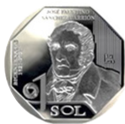
José Faustino Sánchez Carrión