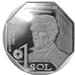
Toribio Rodríguez de Mendoza