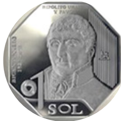
Hipólito Unanue y Pavón