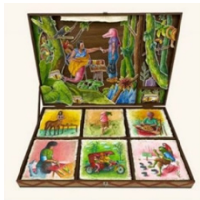
Darwin Castillo Angulo, La vida interminable , 2003