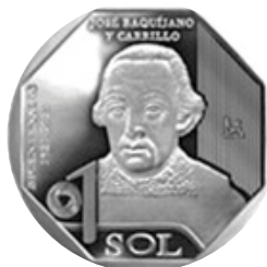
José Baquijano y Carrillo