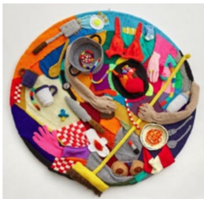
Ariana Macedo, Interminable , primer premio