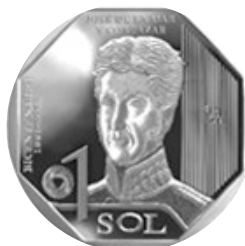
José de la Mar y Cortázar