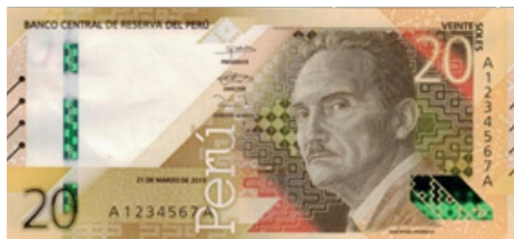
José María Arguedas