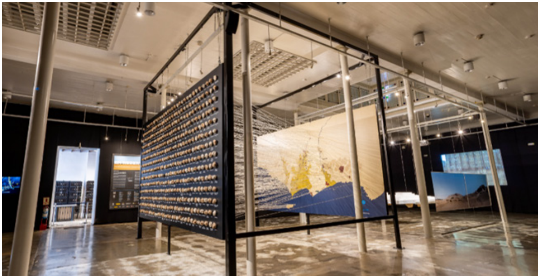
Exposición “En Reserva: 4 000 años de arquitectura y urbanismo en Lima”.