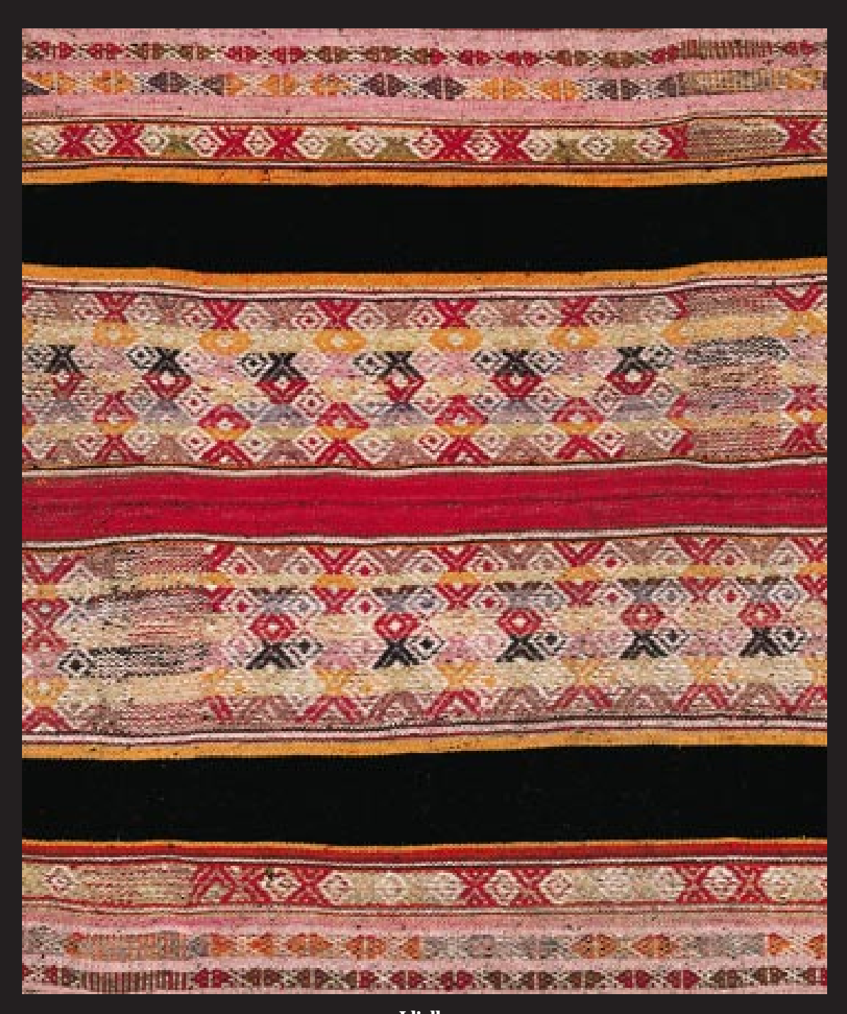
Lliclla Siglo XIX Cusco Sala de Exhibición de Arte Popular Peruano, BCRP