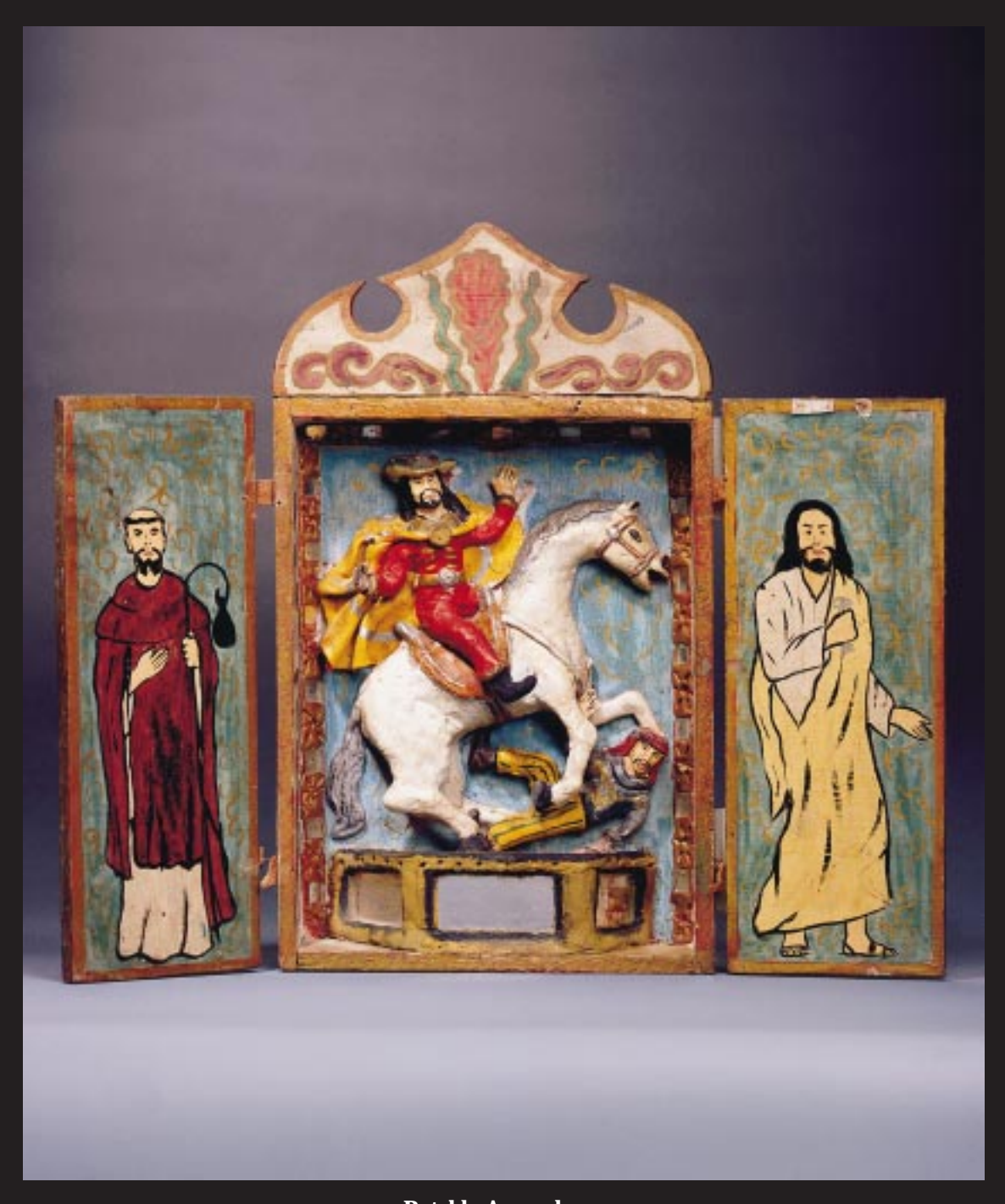
Retablo Ayacuchano Principios Siglo XX Interior Santiago Apóstol Sala de Exhibición de Arte Popular Peruano, BCRP