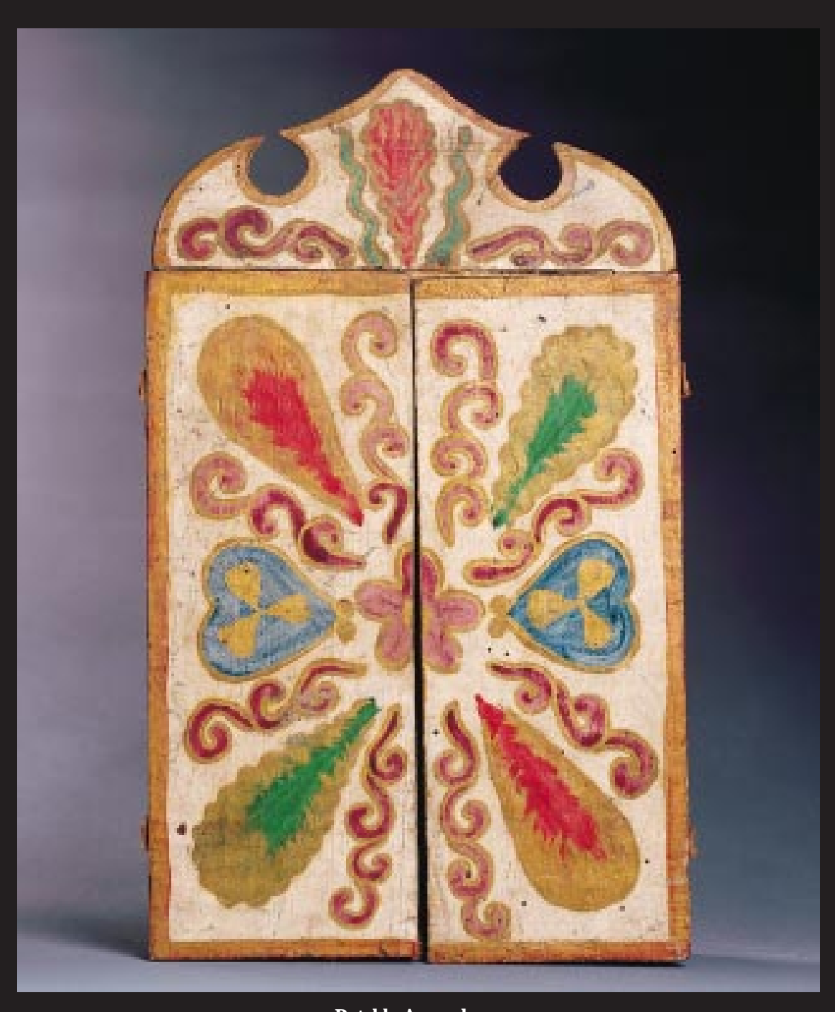
Retablo Ayacuchano Principios Siglo XX Exterior Sala de Exhibición de Arte Popular Peruano, BCRP