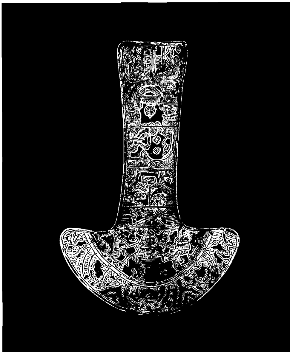
Cultura Lambayeque 700 d. C. - 1350 d. C. Museo del Banco Central de Reserva del Perú