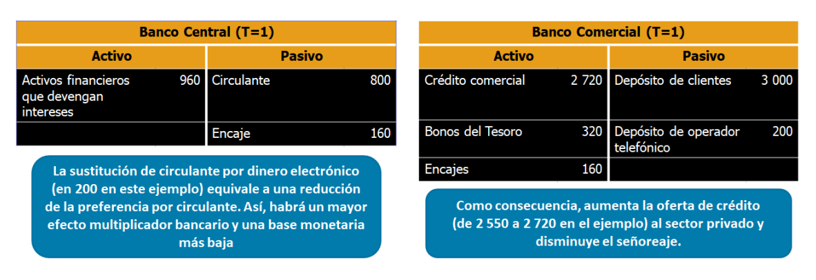
Figura 6 (caso iv): Sustitución de dinero en circulación por dinero electrónico

La sustitución del dinero en circulación por dinero electrónico equivale a una reducción de la preferencia por circulante. Esto conllevaría un mayor efecto multiplicador bancario y una menor base monetaria (1 150 a 960), manteniendo constante la cantidad total de Dinero (4 000); el dinero en circulación como fracción de M1 es ahora del 20 por ciento. Como consecuencia, aumenta la oferta de crédito al sector privado y disminuye el señoreaje.