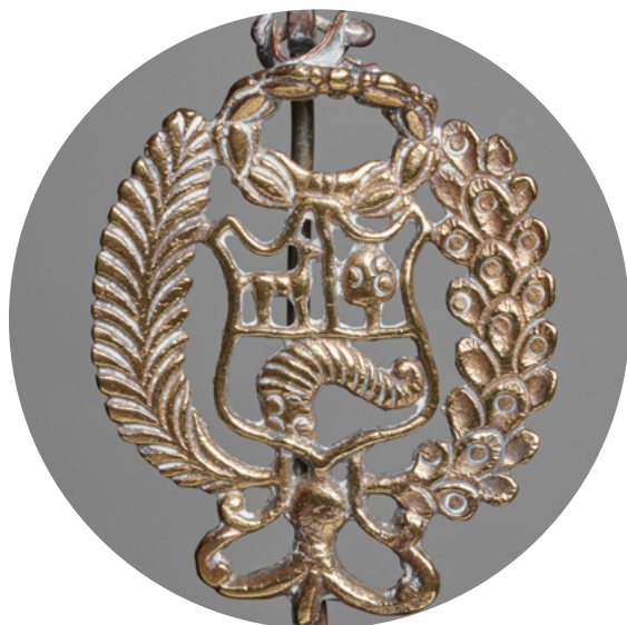
Prendedor del Escudo Nacional Sur andino S. XX