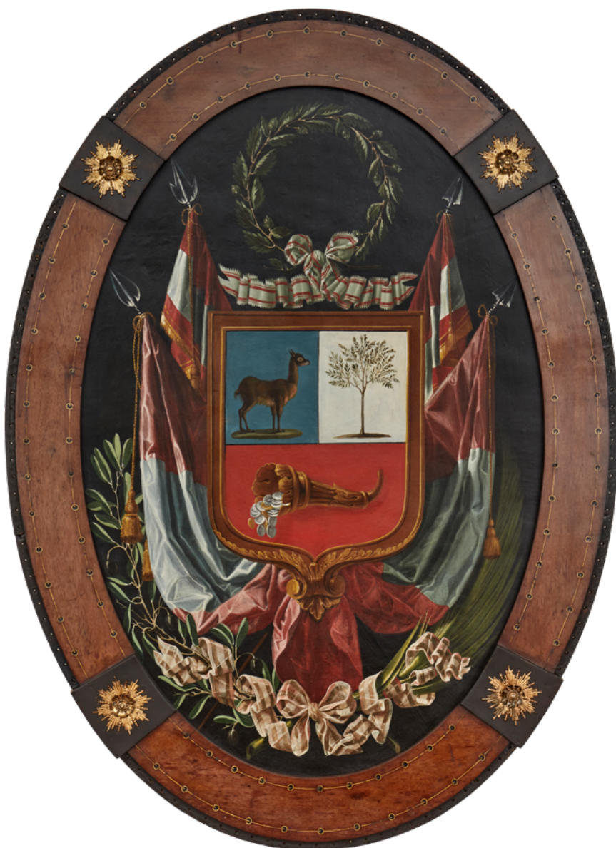
José Leandro Cortés Escudo Nacional del Perú 1832 Óleo sobre madera

Finalmente, la cornucopia con monedas representa nuestra riqueza mineral. Los metales fueron utilizados desde tiempos preíncas, principalmente para la elaboración de objetos rituales. Durante el virreinato, el oro y, en mayor medida, la detrás de plata se extraían en grandes cantidades para posteriormente ser empleados en la elaboración de monedas y de objetos religiosos.