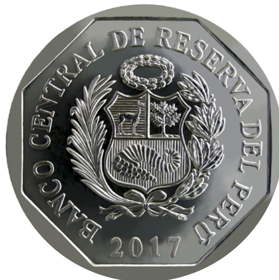
Anverso de Un Sol 2017