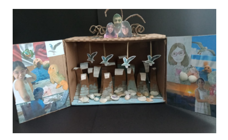
Familia Mendoza Seijas

Pueden fotocopiar algunas fotos, recortarlas y hacer una composición con ellas a través de la técnica del collage. Anímense a incorporar en sus creaciones materiales reciclados o elementos de la naturaleza, como semillas o conchitas marinas. Puedes ver aquí dos de los trabajos realizados en el laboratorio/taller que pueden servirte de inspiración.