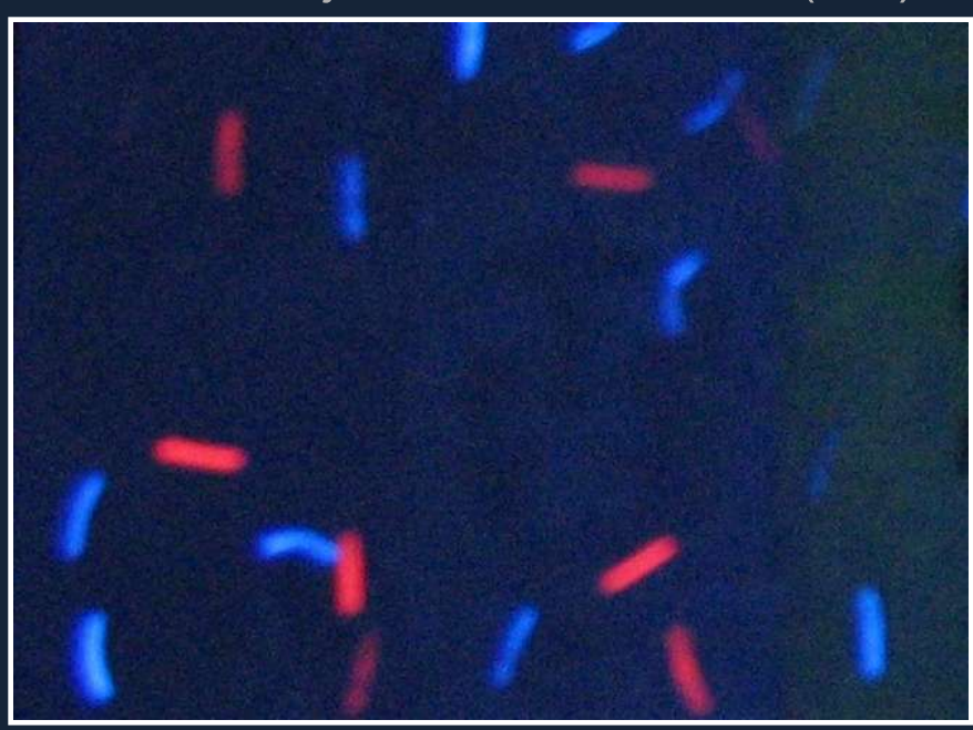
Rojas y azules