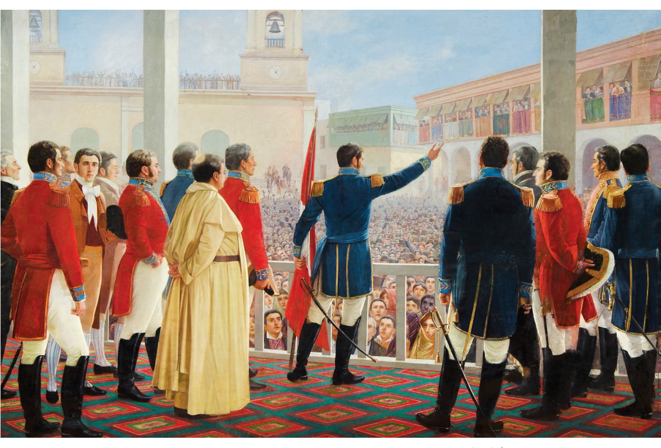
Proclamación de la independencia del Perú (1904). Óleo de Juan B. Lepiani. Colección del MNAAHP.

las jóvenes repúblicas sudamericanas. Esta situación, que nos condujo a un proceso de militarización acelerada (hecho que fue en detrimento de nuestra institucionalidad), nos dota, paradójicamente, de una historia única por su complejidad y dramatismo. El último bastión del Imperio español en Sudamérica tiene la capacidad de convertirse en el espacio donde se discuta en profundidad el alto precio que los pueblos deben de pagar para obtener ese bien supremo llamado libertad.