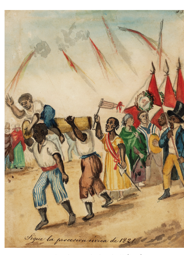
Sigue la procesión cívica de 1821 (S. XIX). Acuarela de Pancho Fierro. Pinacoteca Municipal Ignacio Merino. Municipalidad de Lima.

La exhibición de coraje y valentía de las Toledo y el pueblo de Concepción ocurrió entre marzo y abril de 1821; la fecha no está del todo corroborada. Después de varias cargas de fusilería, de una orilla a la otra, y ante el avance de las fuerzas españolas que iniciaban ya el cruce del río Mantaro, las Toledo, encabezando a los defensores de Concepción, lograron cortar las amarras del puente colgante. Este acto temerario fue ejecutado en medio del fuego enemigo, con una rapidez que hasta hoy sorprende. Los soldados realistas que temerariamente avanzaban ya por el puente se hundieron y algunos probablemente se ahogaron en las tumultuosas aguas del Mantaro. Con esta notable acción de la sociedad civil, los pa-