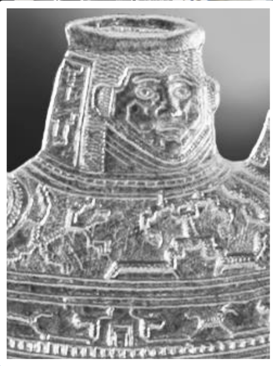
Detalle de la moneda

Líneas ondulantes bien definidas, detrás de la cifra 1 Sol.