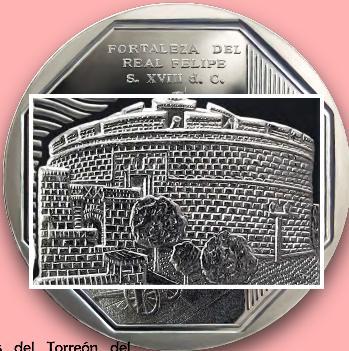
Detalles del Torreón del Rey.