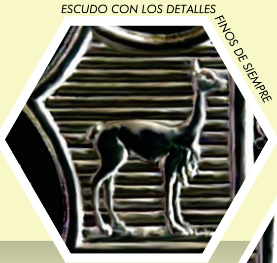
ESCUDO CON LOS DETALLES FINOS DE SIEMPRE