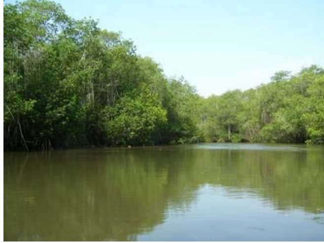
Manglares de Tumbes