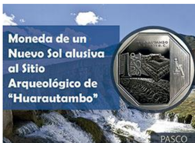
MONEDA ALUSIVA AL SITIO ARQUEOLÓGICO DE “HUARAUTAMBO”

Este conjunto arqueológico es único en todo el Tawantinsuyo, y refleja una visión claramente ligada al culto al agua. En la edificación central existe una hermosa fuente con cuatro vertientes alimentadas desde un manantial en las alturas. Huarautambo asombra no solo por su condición de tambo en el camino sino por el espectacular despliegue de sus fuentes de agua, que solo tiene parangón contemporáneo con el Santuario de Tipón en Cusco y el de la Huaca de los Caranquis en el norte de Ecuador.