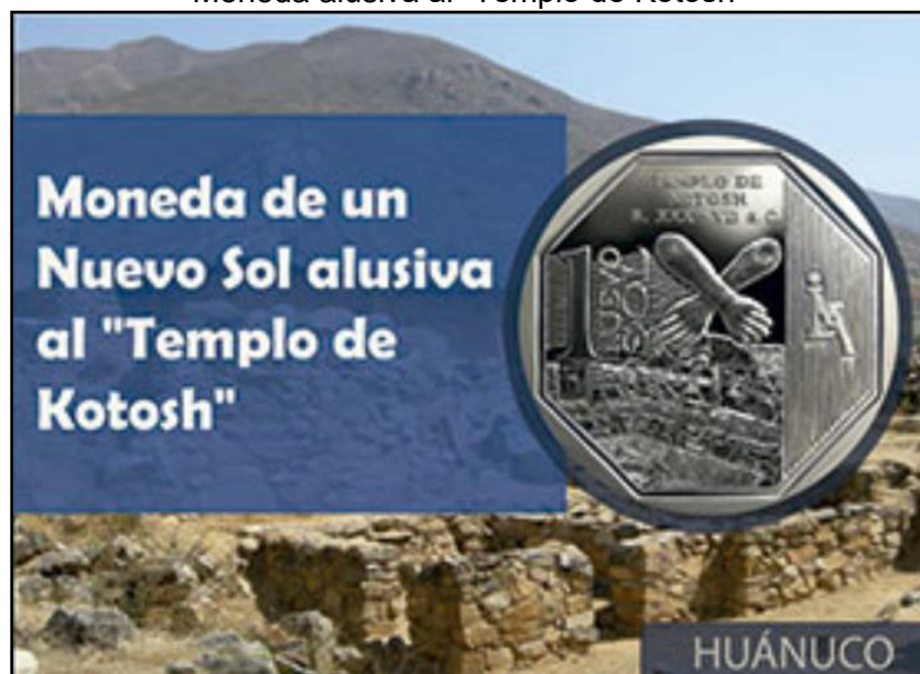
Moneda alusiva al “Templo de Kotosh”