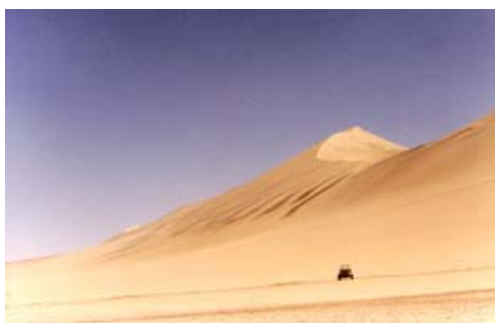
Dunas de Ica: El mejor lugar para la práctica del sandbord