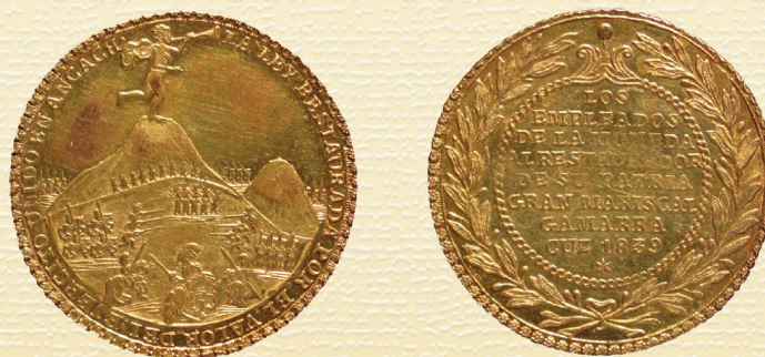
FOTO 2 Y 3: MARISCAL ANDRÉS DE SANTA CRUZ, EN PLATA, Y AL MARISCAL AGUSTÍN GAMARRA, EN ORO, ANVERSO Y REVERSO.

Las medallas no tienen como función ser medio de pago. Sin embargo, algunas piezas de oro y plata tuvieron valor cancelatorio al tener el mismo peso y metal que el circulante de la época.