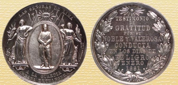
FOTO 7: LAS SEÑORAS DE LIMA OTORGARON ESTA MEDALLA A LA GUARDIA URBANA EXTRANJERA EN 1881, LUEGO DE LA BATALLA DE MIRAFLORES, EN PLATA, ANVERSO Y REVERSO.