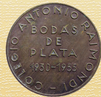
FOTO 11: ANTONIO RAIMONDI, CONMEMORATIVA DE LAS BODAS DE PLATA DEL COLEGIO DEL MISMO NOMBRE.