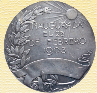
FOTO 8: EXPOSICIÓN DE LAS APLICACIONES INDUSTRIALES DEL ALCOHOL, ANVERSO Y REVERSO.