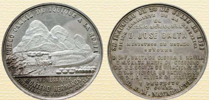
FOTO 6: MEDALLA QUE CONMEMORA LA INAUGURACIÓN DEL FERROCARRIL IQUIQUE A LA NORIA, ANVERSO Y REVERSO.