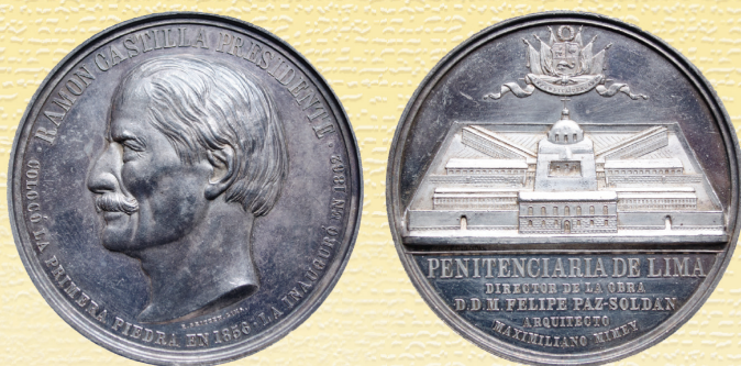
FOTO 4: INAUGURACIÓN DE LA PENITENCIERÍA DE LIMA Y BUSTO DEL PRESIDENTE RAMÓN CASTILLA, EN PLATA, ANVERSO Y REVERSO.