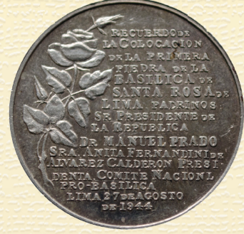
FOTO 9: MEDALLA CONMEMORATIVA DE LA PRIMERA PIEDRA DE LA BASÍLICA DE SANTA ROSA DE LIMA, ANVERSO Y REVERSO.