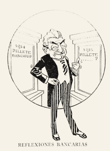
—Bendigo tu memoria; ¡oh extraordinario 1914! que nos has dejado la fecunda herencia del billete bancario ¿Qué nos dejará tu sucesor?...