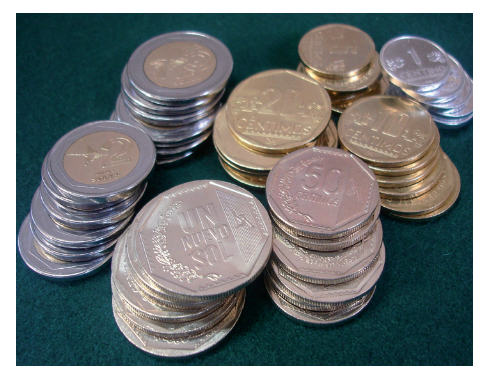
PREFERENCIA. En los últimos años con la caída de la dolarización, la moneda nacional ha ganado terreno y hoy cada vez más peruanos la usan en sus operaciones

Por ejemplo, en teoría, si un banco central prevé futuros incrementos en la demanda agregada que comprometen el objetivo de inflación (1,5-3,5 por ciento), el banco debería anticiparse a estos eventos futuros incrementando la tasa de referencia hoy de tal forma que la demanda agregada y las expectativas de inflación disminuyan en el futuro. Este sería el mecanismo tradicional de ajuste. No obstante, en una economía con dolarización parcial, tasas en monedas extranjeras afectan la demanda agregada y consecuentemente los mecanismos de transmisión de la política podrían ser mitigados<sup>8</sup>.