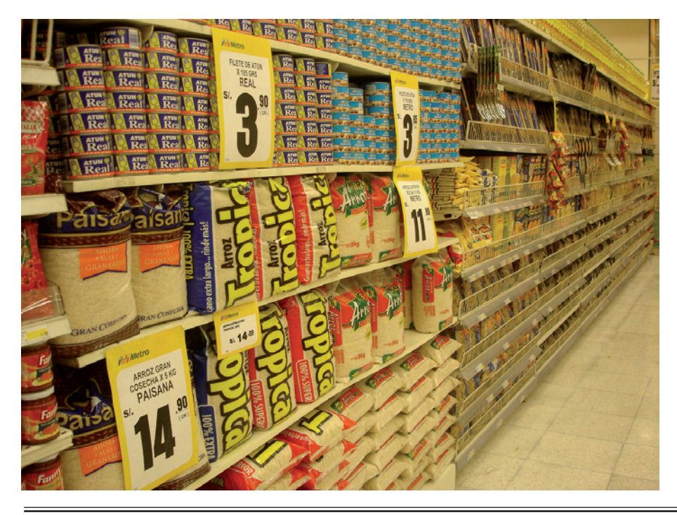
PRECIOS. Cuando la mayor parte de sus costos están en dólares, las empresas tienden a poner sus precios en dólares.

Actualmente, la política monetaria opera a través del manejo de la tasa de interés de corto plazo, denominada tasa de referencia. La efectividad de la política monetaria se mide por el efecto que pueda tener el accionar previsor del banco central, a través del manejo de la tasa de interés, sobre la demanda agregada y, consecuentemente, sobre la inflación y las expectativas de esta última.