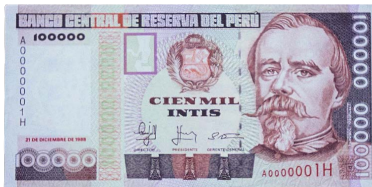
Imagen principal: Francisco Bolognesi