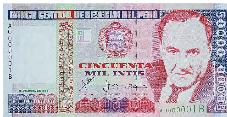
Imagen principal: Víctor Raúl Haya de la Torre