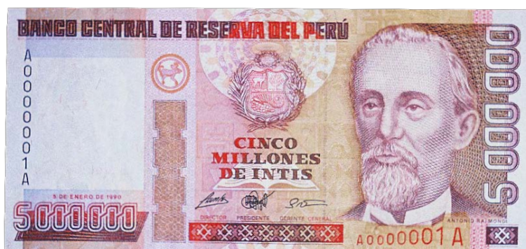
Imagen principal: Antonio Raimondi