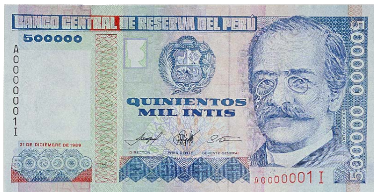
Imagen principal: Ricardo Palma