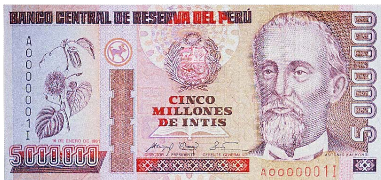
Imagen principal: Antonio Raimondi