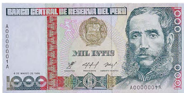
Imagen principal: Andrés Avelino Cáceres