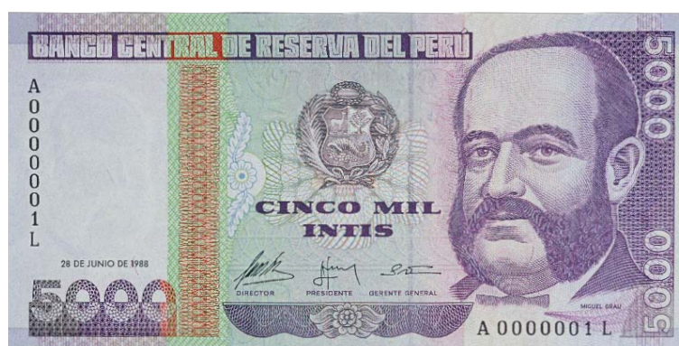
Imagen principal: Miguel Grau