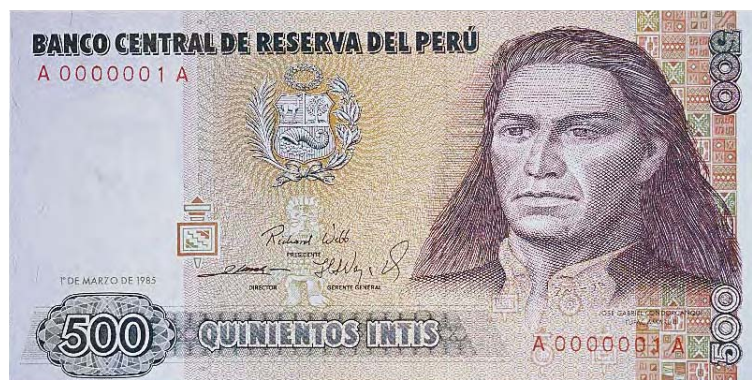
Imagen principal: José Gabriel Condorcanqui, Túpac Amaru II