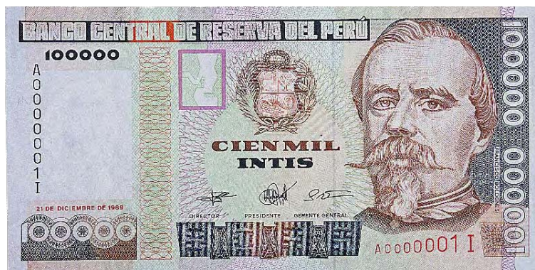
Imagen principal: Francisco Bolognesi