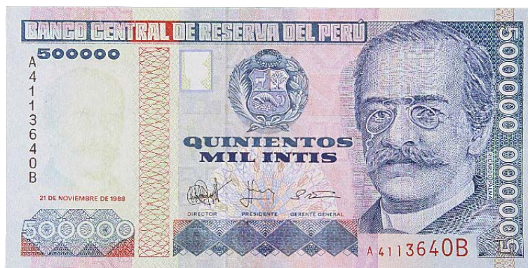
Imagen principal: Ricardo Palma