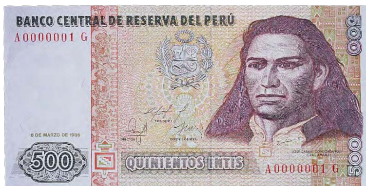
Imagen principal: José Gabriel Condorcanqui, Túpac Amaru II