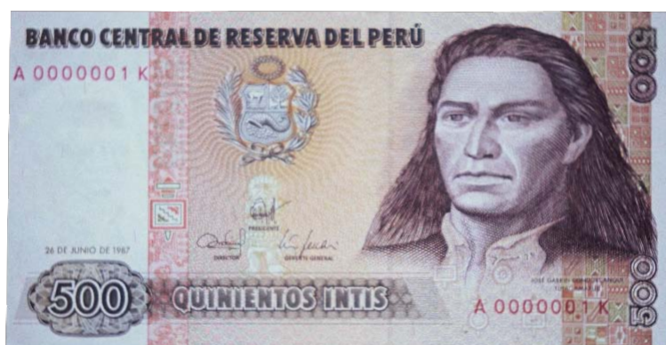
Imagen principal: José Gabriel Condorcanqui, Túpac Amaru II