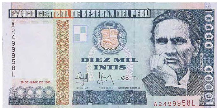
Imagen principal: César Vallejo