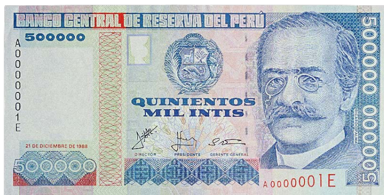
Imagen principal: Ricardo Palma