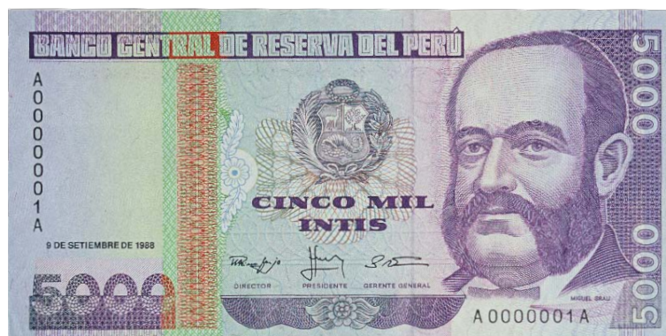
Imagen principal: Miguel Grau