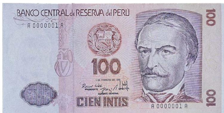
Imagen principal: Ramón Castilla