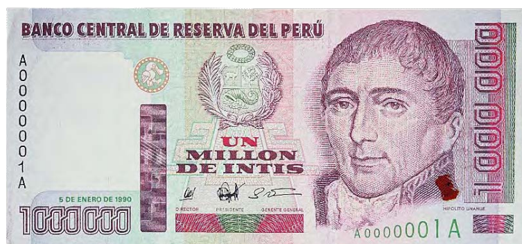
Imagen principal: Hipólito Unanue