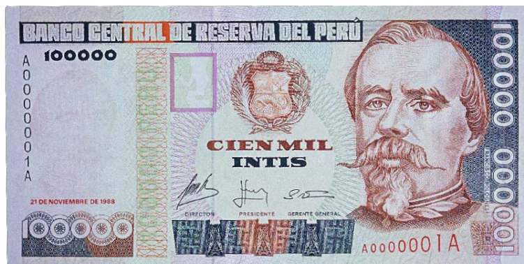
Imagen principal: Francisco Bolognesi