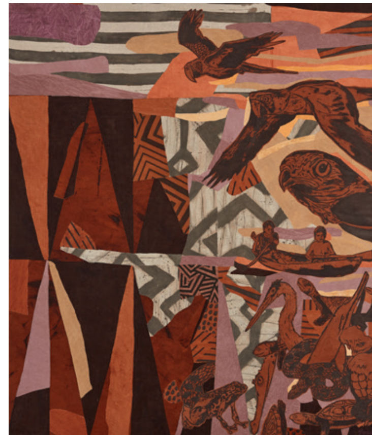
"Canta el bosque" | Pigmentos naturales, collage y mixta / 170 x 150 cm