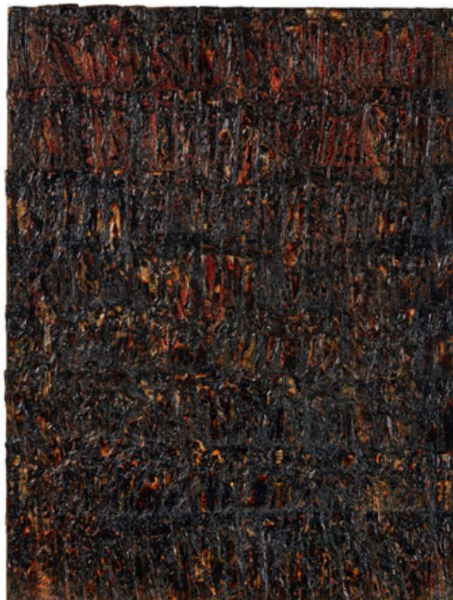
"De memoria V." | Mixta sobre MDF / 170 x 128 cm