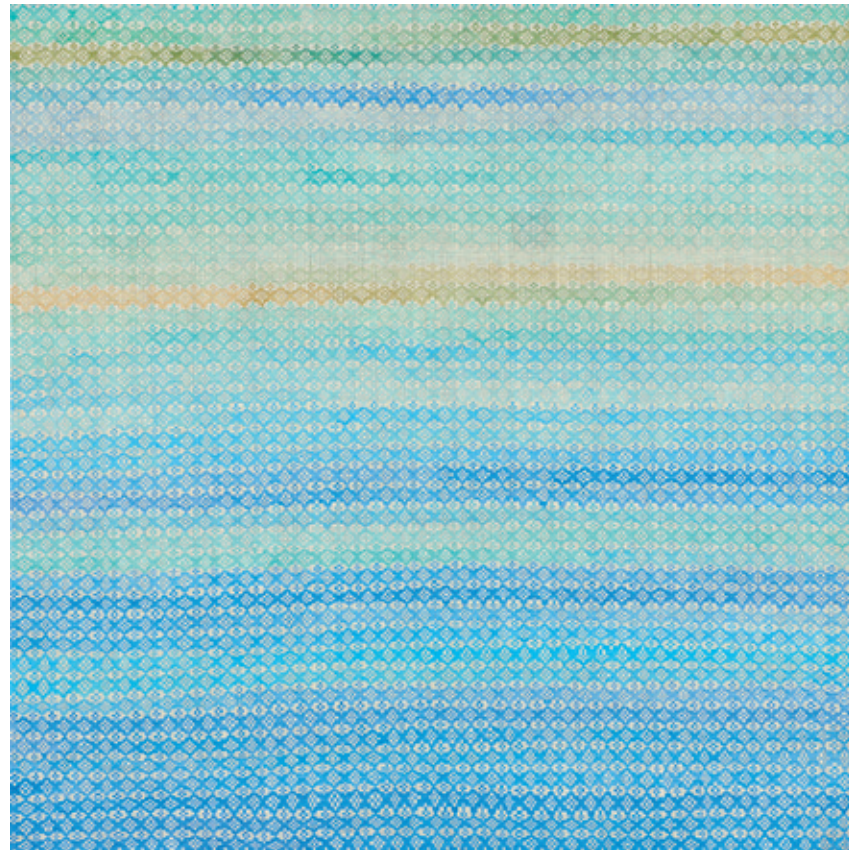
"Chinancocha, manto bordado con turquesas" | Óleo sobre lino / 170 x 170 cm