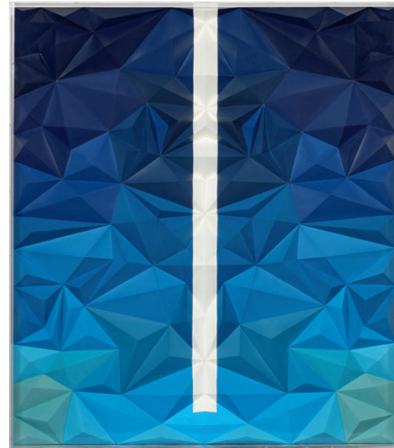
"Escaleno fragmentado" | Papel plegado y pintado sobre madera / 145 x 126.5 x 13 cm