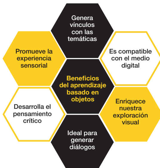
Fig. 3 Cuadro de beneficios. Elaborado con base a UCL (s/f), Hooper-Greenhill, E (1996), Chatterjee, H (2009)

Los principales beneficios de utilizar esta metodología son las oportunidades que genera para establecer vínculos con las temáticas del aula, así como para promover la exploración sensorial de los objetos y el desarrollo del pensamiento crítico.