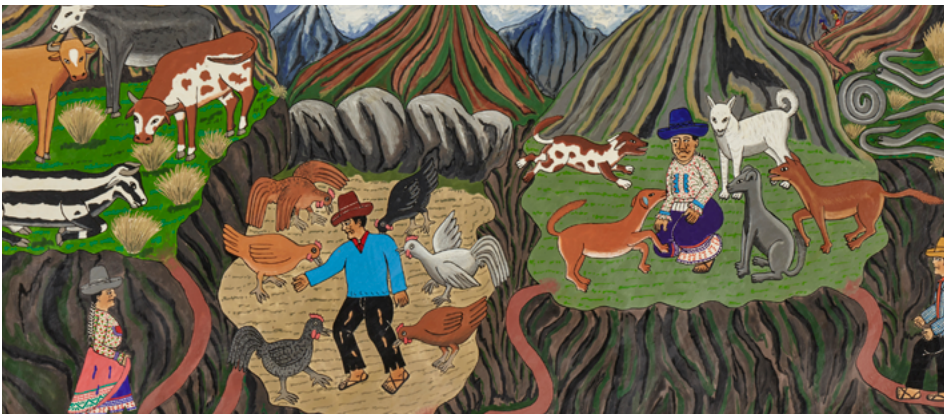
Carmelón Berrocal Los pueblos de los animales Sarhua, S.XX Pintura sobre madera

El historiador Pablo Macera, investigador de artes tradicionales, menciona que las tablas o tablones originales son vigas que formaban parte de las edificaciones de Sarhua hasta la década de 1970. Estos tablones servían como soporte para el techo de las casas y eran regalados por los padrinos o “compadres de techo” a los dueños de casa. Algunas tablas de Sarhua presentan adaptaciones de las tablas tradicionales a formatos más contemporáneos con el fin de que sirvan como sustento económico como son las ventas de artesanía.