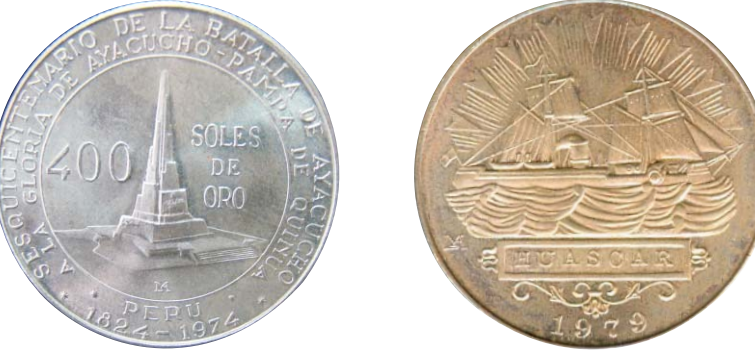
Sesquicentenario de la Batalla de Ayacucho