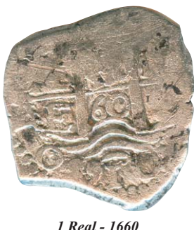
Conde de Alva de Liste