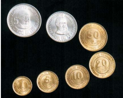
S/. 50,000 = I /. 50 S/. 10,000 = I /. 10 S/. 5,000 = I /. 5 S/. 1,000 = I /. 1 S/. 500 = I /. 0.50 = 50 Céntimos S/. 100 = I /. 0.10 = 10 Céntimos S/. 50 = I /. 0.05 = 5 Céntimos S/. 10 = I /. 0.01 = 1 Céntimos

Las equivalencias entre las monedas y billetes de soles de oro y los intis son como sigue: