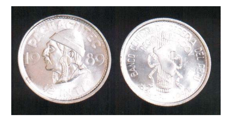
Moneda conmemorativa alusiva a Pachacutec

Para dar a conocer al público estos sucesos, el Banco Central de Reserva del Perú las acuña en oro y en plata.