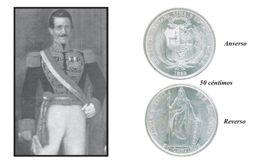
Mariscal don Ramón Castilla

Uno de los problemas monetarios más graves del siglo XIX fue la introducción de moneda feble desde Bolivia, la cual desplazaba a la moneda peruana de mejor ley. En 1857, durante el gobierno del Mariscal Ramón Castilla, se trató de solucionar el problema y se dictó una ley que cambiaba el antiguo sistema de valores de "Pesos" y "Escudos" ; se dejó de lado el sistema de base 8 y se adoptó el sistema métrico decimal, con lo que aparecieron las llamadas "Monedas Transitorias" . Castilla modernizó la Casa de Moneda con la adquisición de nueva maquinaria y la contratación de personal especializado en el extranjero, entre el que destacaba el grabador británico Robert Britten.