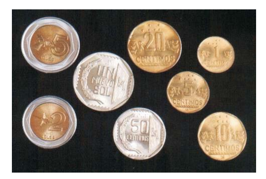
Fracciones de moneda de Nuevo Sol

Las monedas de Un Nuevo Sol acuñadas en alpaca son de color blanco, con un diámetro de 25.5 milímetros y un peso de 7.32 grs. Las de 50 céntimos, del mismo metal y color, tienen 22 milímetros de diámetro y un peso de 5.45 grs.