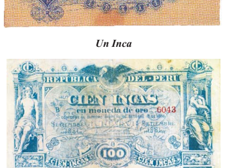
acuñada en Ayacucho en 1881