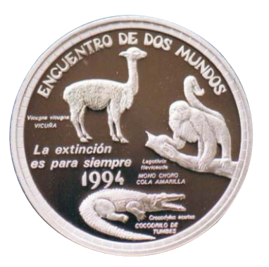
II Serie Iberoamericana Animales autóctonos en peligro de extinción