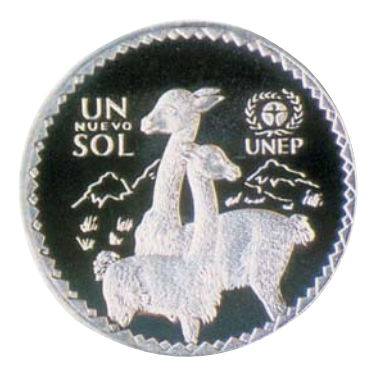
Programa de las Naciones Unidas para el Medio Ambiente