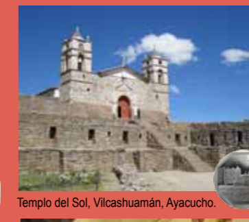
Templo del Sol, Vilcashuamán, Ayacucho.