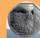
Moneda alusiva a Machu Picchu.