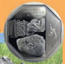
Moneda alusiva a la Piedra de Saywite.