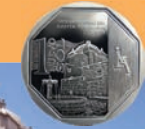
Moneda alusiva al Monasterio de Santa Catalina.