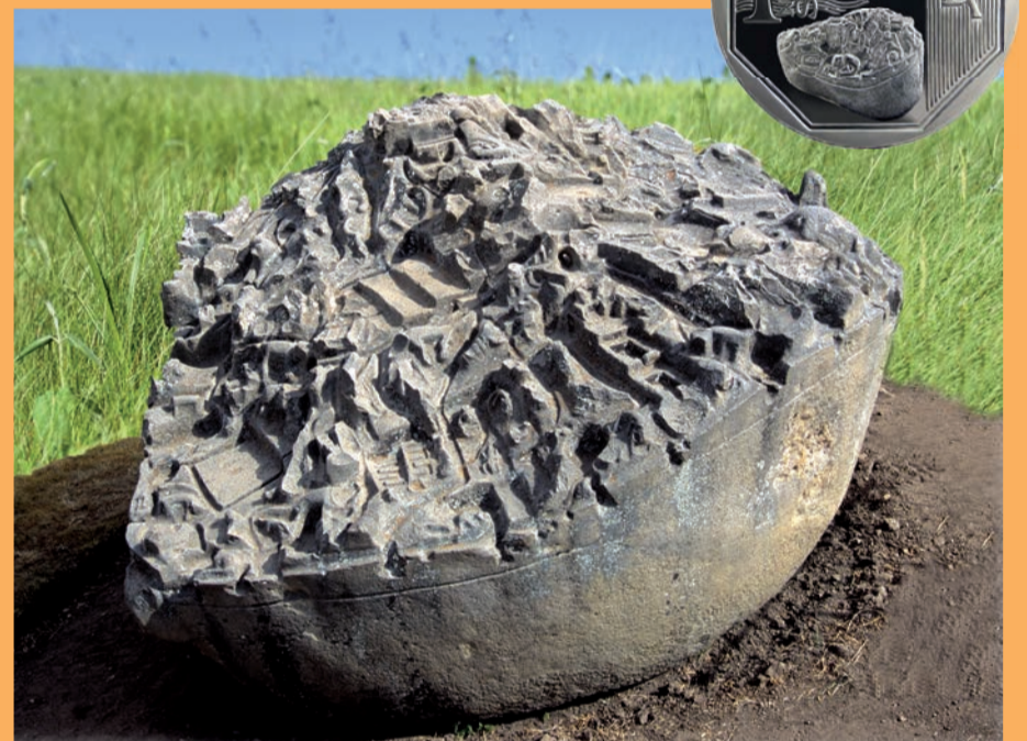
Moneda alusiva a la Piedra de Saywite.