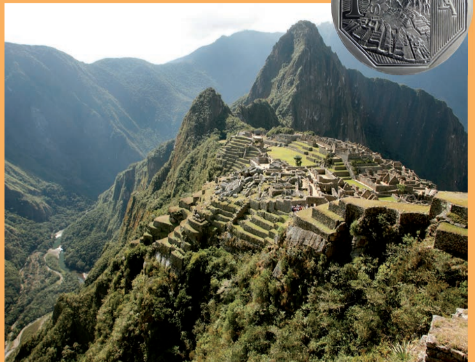
Moneda alusiva a Machu Picchu, maravilla del mundo.